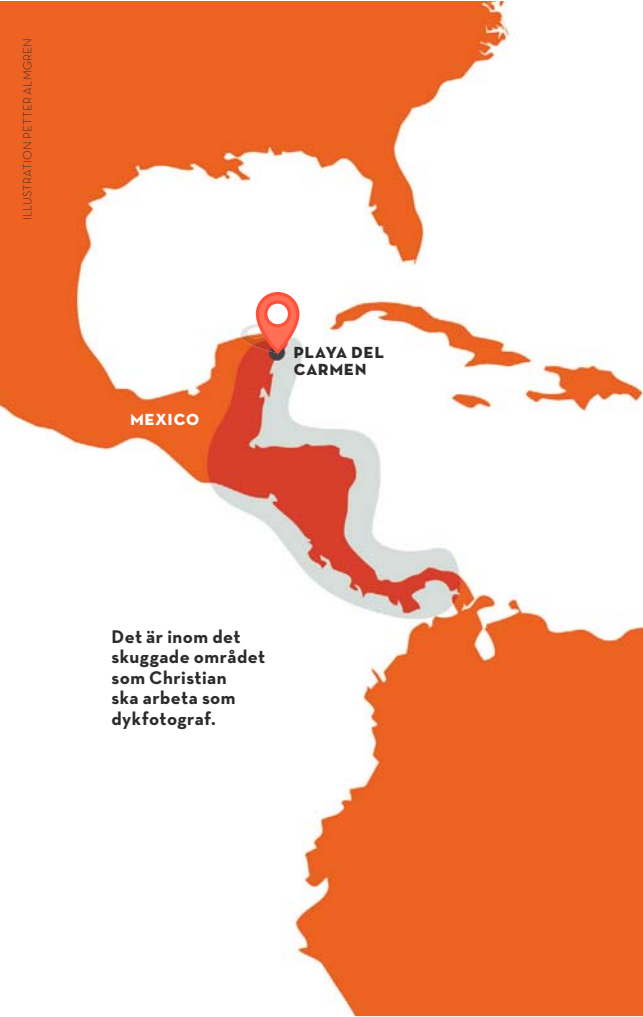
Det är inom det skuggade området som Christian ska arbeta som dykfotograf.